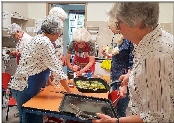
Workshop Bijbels Koken