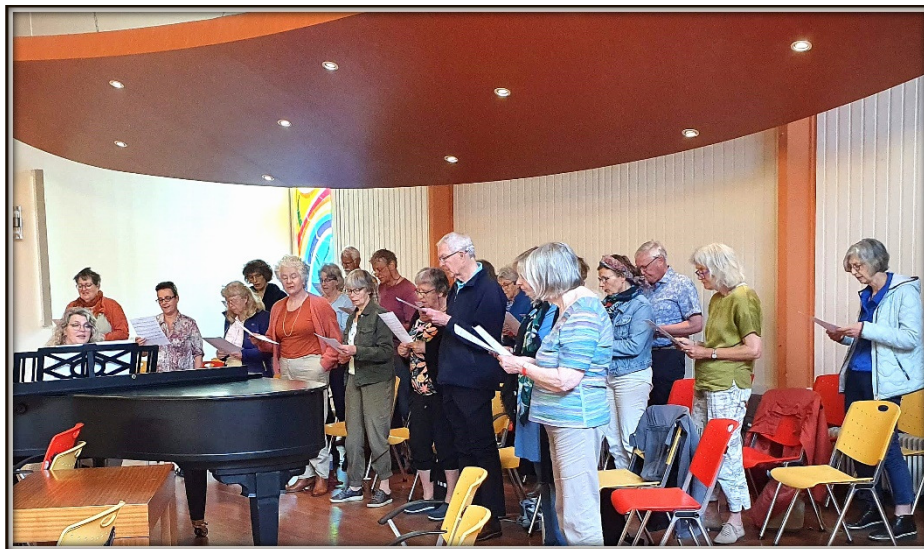
Workshop Jiddisch Zingen