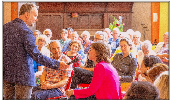
Symposium De wijk in gesprek