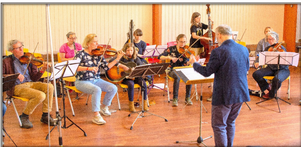
Scratch-orkest tijdens de borrel