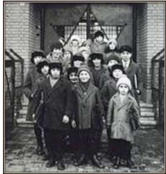
Foto van Joodse kinderen voor het Joods Weeshuis

Helaas is er dit jaar dus geen herdenking. Wellicht dat u op uw eigen manier op een door u gekozen moment invulling kan geven aan de Herdenking van de Jodenvervolging dit jaar.