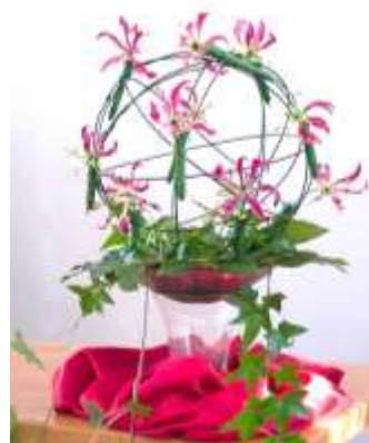
(Liturgisch bloemschikken Pinksteren)

De redactie wenst u weer veel leesplezier.