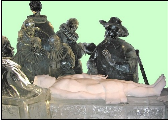
(IJssculptuur van De Anatomische Les)

In alle rust en met blote handen, kon ik kennismaken met iets wat ik nooit eerder had kunnen bevatten.