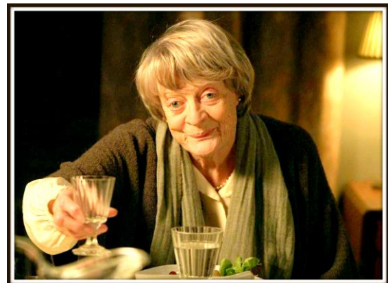
My old Lady

Dit seizoen kijken wij weer naar films die je raken, omdat je veel herkent in jezelf en om je heen: een oude vrouw die haar geheimen verbergt in een oud huis, een jonge vrouw die alleen door solidariteit van haar collega's haar baan kan houden, een jonge Poolse non die