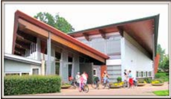
Het brandpunt Amersfoort

priester. De gehele gemeenschap participeerde in beide vieringen. Maar we wilden de verantwoordelijkheid niet vermengen. Dat wilden we helder laten staan. Toch is er op een gegeven ogenblik een einde gekomen aan deze vieringen. We deden blijkbaar iets wat officieel van de kerken niet mocht. Het regime werd strenger. Het mocht echt niet meer. Dat was pijnpunt voor de geloofsgemeenschap, dat je bepaalde rituelen niet meer mag uitvoeren. Dat heeft geleid tot verzet en pijn. Mensen stellen vragen: Waarom mogen we de kracht van elkaars rituelen en tradities niet proberen te waarderen, waarom mag dat niet meer?'