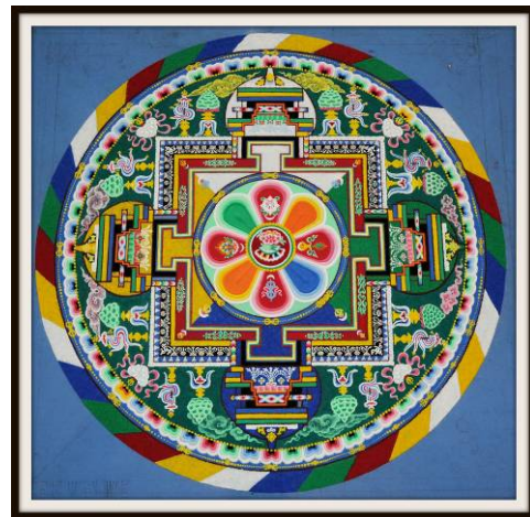
Zandmandala van Compassie

Zondag 10 november valt in een week met heel veel activiteiten waarin het thema 'ik en de ander' centraal staan. Op 9 en 10 november is het Diakonaal Weekend in de Bakkerij. Daarin wordt een project opgestart om het voedselpakket van de voedselbanken gevarieerder te krijgen en tegelijk een daaraan verwant project om gezond te leren koken met een kleine beurs. Vooral bij mensen voor wie onze voedingsmiddelen niet vertrouwd zijn (vluchtelingen b.v.) een heel belangrijk aandachtspunt. Het is sowieso niet voor iedereen vanzelfsprekend om een uitgebalanceerd menu op tafel te zetten. Voor deze projecten worden (o.a.) kerken gezocht om ze te sponsoren. U hoort er meer van! Zelf starten we deze zondag met het jaarthema: Compassie .