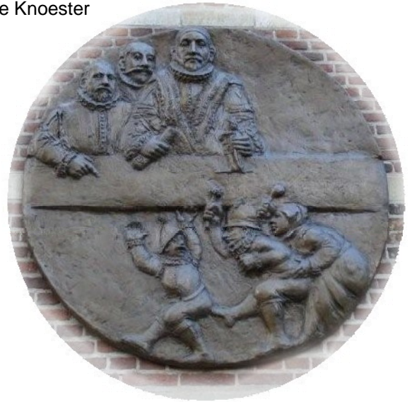
Leidens Ontzet 1574