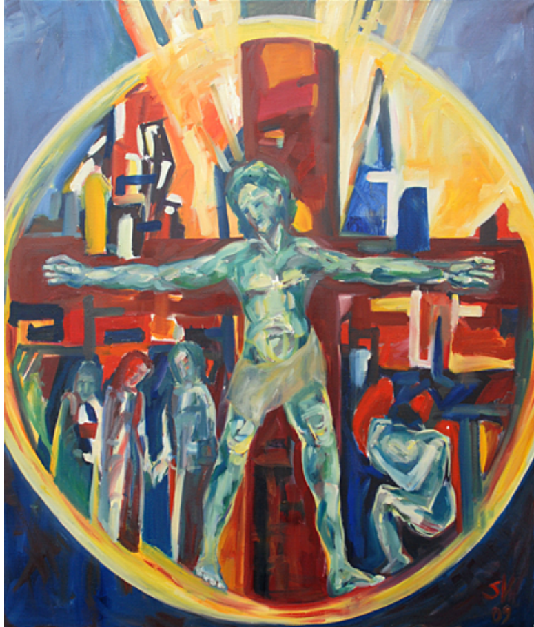
Zeig uns durch deine Passion olieverf op linnen.100x120cm, 2009