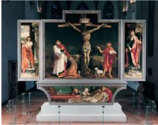
Grünewald: Isenheimer Altaar